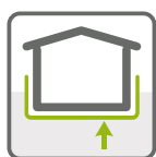
HYDROIZOLACE SPODNÍ STAVBY

HYDROIZOLAČNÍ PÁS Z OXIDOVANÉHO ASFALTU S VLOŽKOU Z HLINÍKOVÉ FÓLIE A SKELNÉ ROHOŽE S POVRCHOVOU ÚPRAVOU MINERÁLNÍM JEMNOZRNNÝM POSYPEM